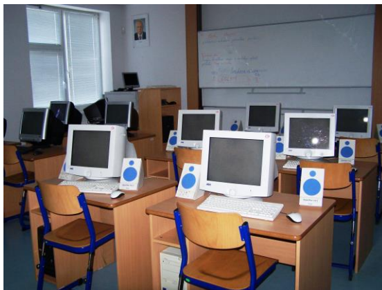
učebna výpočetní techniky

V učebně výpočetní techniky je 13 počítačů, takže vzhledem k nižšímu počtu žáků ve třídě má každý možnost pracovat samostatně, včetně využití internetu.