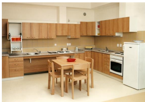
cvičná kuchyň s úpravami pro vozíčkáře

Cvičná kuchyň je vybavena myčkou nádobí, horkovzdušnými troubami, fritézou, mikrovlnnou troubou, lednicí, mixéry atd. Sektorový nábytek je přizpůsoben potřebám vozíčkářů – horní díly se dají stáhnout na výšku sedícího člověka.