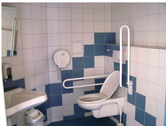
toaleta pro vozíčkáře

Škola je vybavena vysokým počtem běžných toalet i toalet upravených pro vozíčkáře. K dispozici je i řada sprchových koutů pro učitele a žáky. Některé z nich jsou rovněž upraveny pro potřeby vozíčkářů.