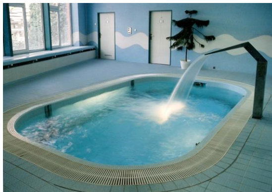
rehabilitační bazén s posuvným dnem

Cvičná kuchyň je vybavena myčkou nádobí, horkovzdušnými troubami, fritézou, mikrovlnnou troubou, lednicí, mixéry atd. Sektorový nábytek je přizpůsoben potřebám vozíčkářů – horní díly se dají stáhnout na výšku sedícího člověka.