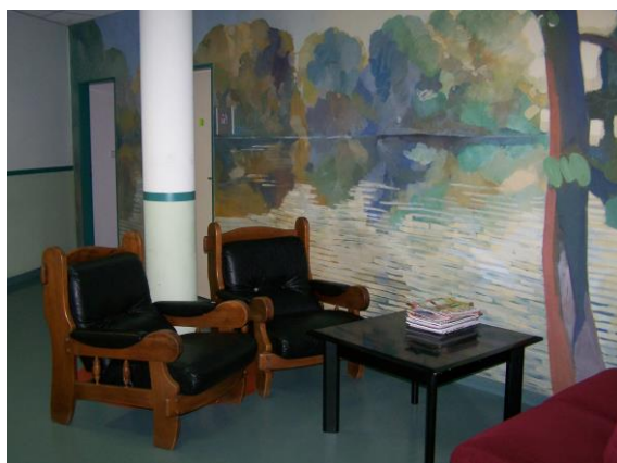
speciálně pedagogické centrum

Speciálně pedagogické centrum se nachází v části areálu, kde má své pracoviště pedagogicko-psychologická poradna. K dispozici má dvě kanceláře.